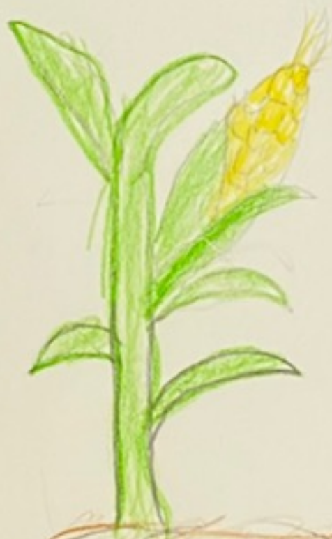
とうもろこしのかおとみ