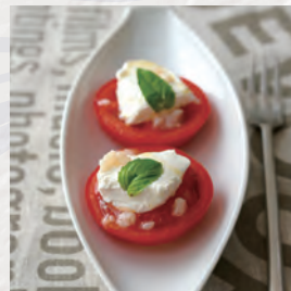
カプレーゼ風サラダ