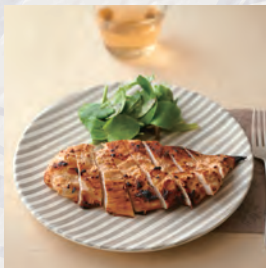
タンドリーチキン

オープン料理、サラダ、スイーツなど、水切りヨーグルトはさまざまな調理法でお楽しみいただけます。水切りヨーグルトポケットレシピが付属されておりますので、買ったその日から様々な料理がお作りいただけます。