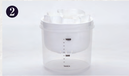
2 水切りざるの中にペーパーフィルター(キッチンペーパーでも可)をセットします