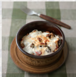
ヨーグルトグラタン