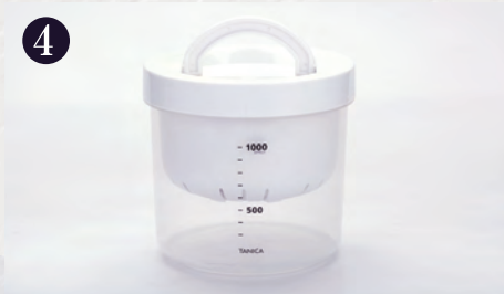
4 ハンドル付きネジふたをしっかりと閉めて冷蔵庫の中へ入れます