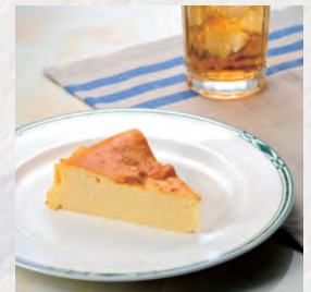
ヨーグルトケーキ