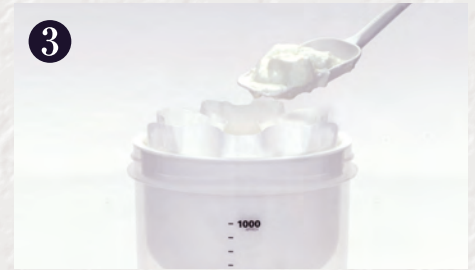
3 ヨーグルトを入れます(100g~500g)