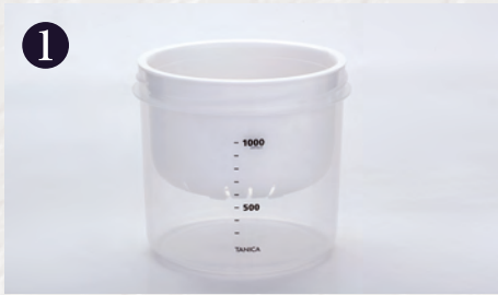
1 内容器に水切りざるをセットします

水切りバスケットSを使えば、とってもかんたんに水切りヨーグルトが作れます。バスケットにセットして、あとは好みの固さになるまで待つだけ! 様々なレシピに合わせて固さを調節してください。