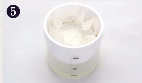
5 約3~6時間で完成です。お好みに応じて水切り時間を調節してください